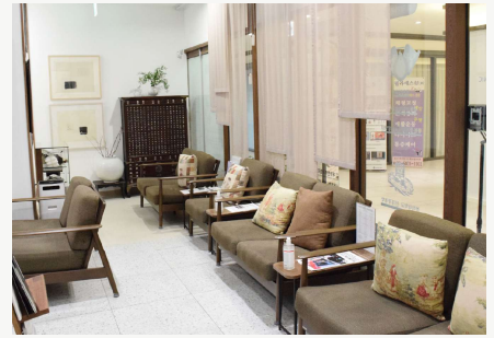
KH RYU 韓医院 内部