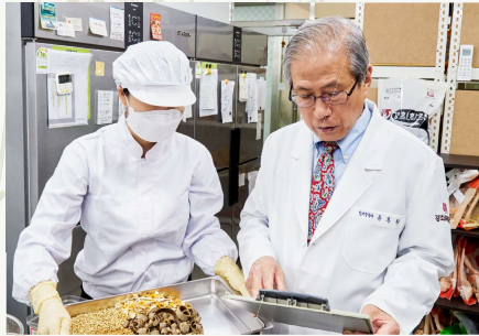
KH RYU 韓薬物研究所