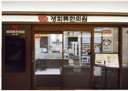
KH RYU 韓医院 外観