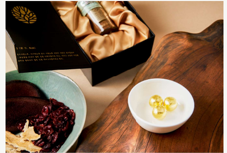
回春堂 原方麝香拱辰丹